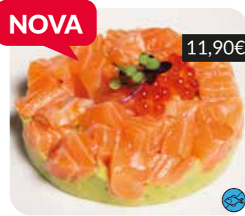
Tàrtar de salmó amb crema d'alvocat