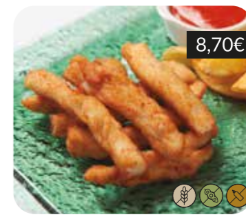
Tires de pollastre arrebossades