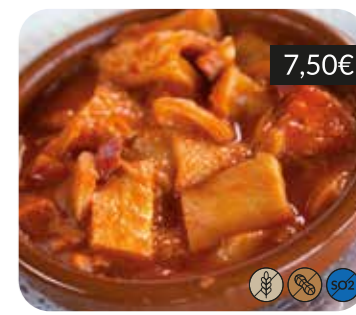
"Callos" de vedella