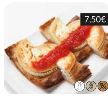
Torrada de formatge de cabra amb compota de tomàquet