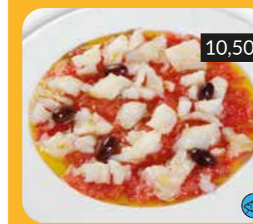
Esqueixada de bacallà