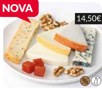
Taula de formatges