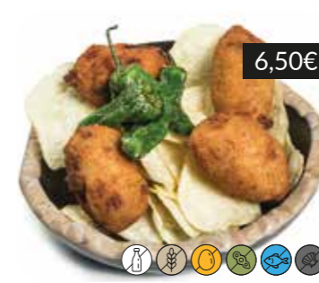
Les croquetes de sempre