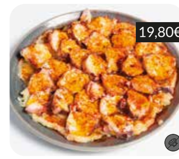
Pop a la gallega