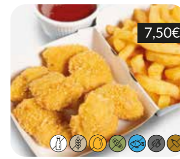
Nuggets de pollastre