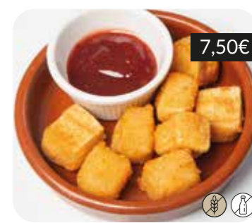
Daus de Brie cruixent amb salsa de gerds