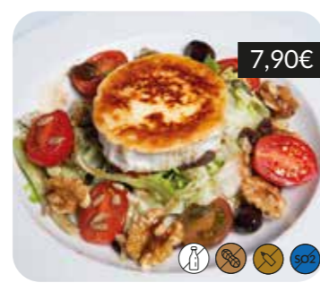
Brots silvestres amb formatge de cabra