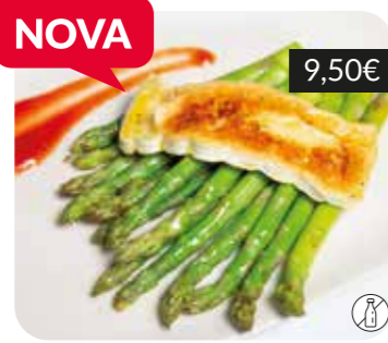
Espàrrecs verds amb Brie i tomàquet dolç