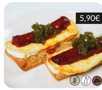
"Montadito" de xistorra, brie i compota de pebrot verd