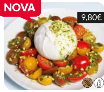
Burrata amb festival de cherrys, alfàbrega i festucs