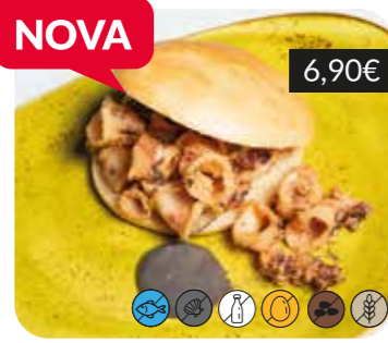
Entrep Janet de calamars i allioli de tinta