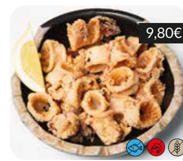
Calamars a l'andalusa