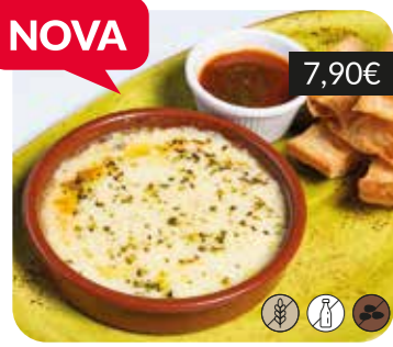
Provoleta amb chimichurri i pa torrat