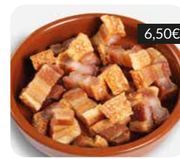
Torrezno de Soria