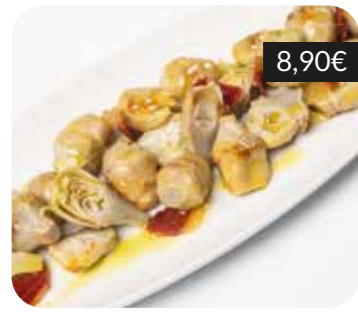
Mini-carxofes amb pernillet