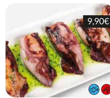
Calamarsons a la planxa