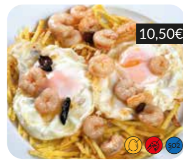
Ous "estrellats" amb gambes a l'ajillo