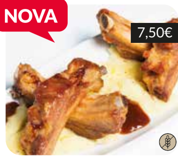
Costelles molt tendres estil BBQ