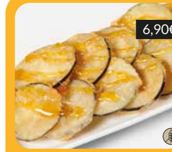
Albergínies en tempura amb mel