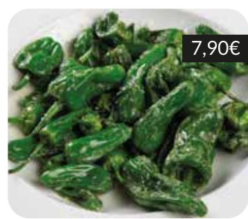
Pebrots de Padrón