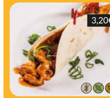
"Burrito" de pollastre Tex-Mex