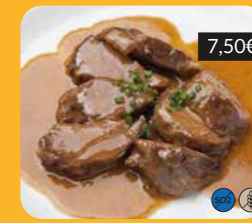
Galtes de porc guisades