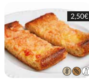
Coca de Folgueroles

• Preparam tapes per emportar, tenim menús per a grups, organitzem convits i celebracions especials. Demana'ns informació.