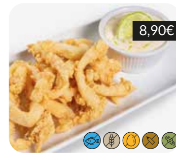
Rabes de sípia amb maionesa de cítrics