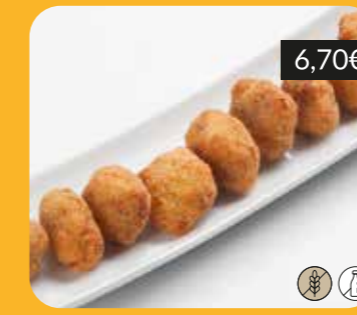
Mini-croquetes de pernil ibèric