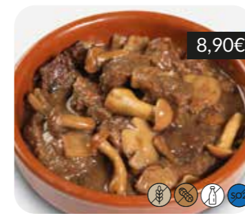
Vedella amb bolets