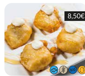
"Soldaditos" de bacallà