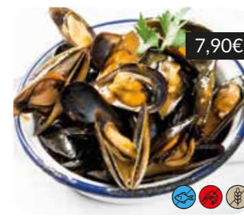
Musclos de roca a la marinera