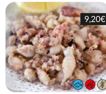
Xipirons a l'andalusa