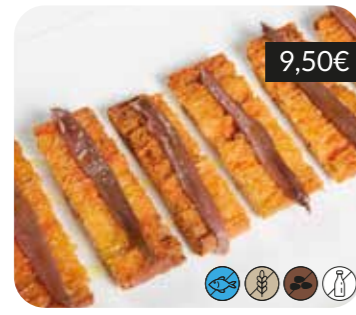
Anxoves i pa amb tomàquet