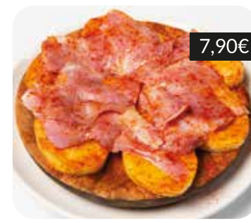
Lacón a la gallega