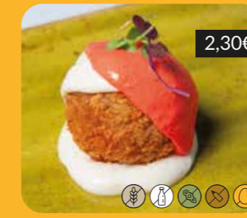
Bomba de la Barceloneta