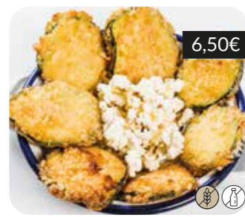
"Bocaditos" de carbassó i formatge de cabra