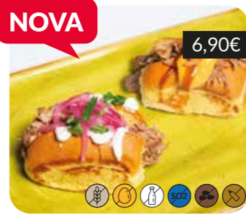
Mini-brioixos de "pulled pork"