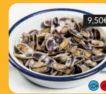
Tallarines a la planxa amb sal i pebre